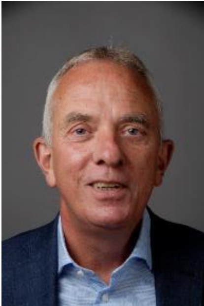
VAN DE RECTOR

Laat ik beginnen te zeggen dat ik hoop dat 2025 een mooi jaar zal worden. Het schooljaar is na de kerstvakantie weer goed van start gegaan en ik vermoed dat leerlingen en docenten veel goede voornemens hebben; dat die allemaal gerealiseerd mogen worden!